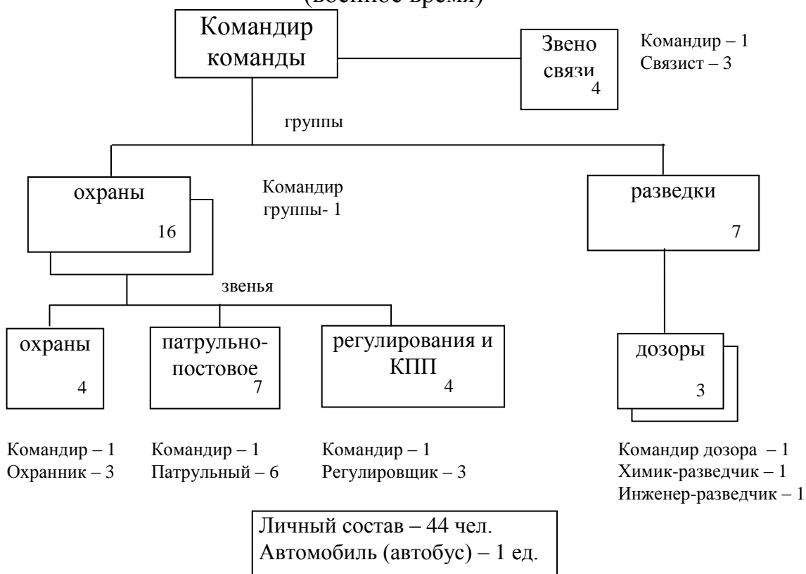
Рисунок 2 – Команда охраны общественного порядка кооп (мирное время)